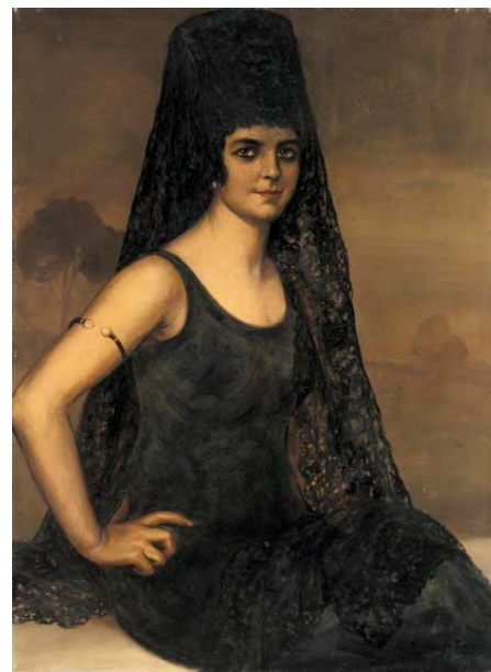
Pastora Imperio, por Julio Romero de Torres

El estreno de la obra original tuvo lugar el 15 de marzo en el Teatro Lara de Madrid. Falla dijo que habían conseguido una "obra rara, nueva" que "habían sentido", aunque desconocían el efecto que pudiera tener en el público.