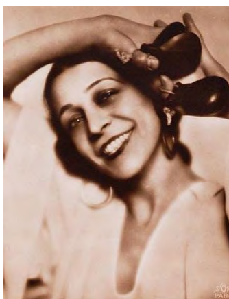
Antonia Mercé La argentina

No obtuvo el éxito esperado y el compositor revisó la obra para transformarla en una de sus partituras más importantes. Diez años más tarde, en 1925, se estrena la versión definitiva para ballet con Antonia Mercé La Argentina , responsable también de la coreografía, en el papel de Candela. El amor brujo, inspirado en los ritmos y sonoridades del cante jondo, nos cuenta una historia de misterio, hechizos y fantasmas protagonizada una joven gitana, Candela, enamorada de Carmelo, pero atormentada por el espectro celoso de su antiguo amante. La versión de 1925 consta de 13 escenas. Las que se interpretan en este concierto, a excepción de las partes cantadas (la Canción del amor dolido y la Canción del fuego fatuo ) son: