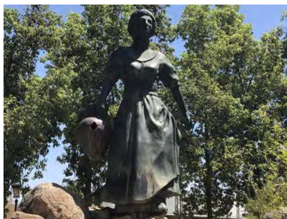
Fuente de María Bellido en Bailén

La leyenda del abanico-Suite nº 1 (2020) es una obra sobre ritmos y danzas tradicionales que se enriquece con elementos muy visuales: percusión corporal y utilización de abanicos como instrumentos rítmicos. Sus dos movimientos, “A la sombra de los granados” (fandango), y “Todos a la jota” (danza de bulería y jota), han sido extraídos del cuento musical La leyenda del abanico (2018), basado en una heroína de la Guerra de la Independencia, María Bellido, una de las aguadoras que arriesgaron su vida para calmar la sed de los soldados durante la Batalla de Bailén. Su cántaro roto por una bala forma parte del escudo de Bailén.