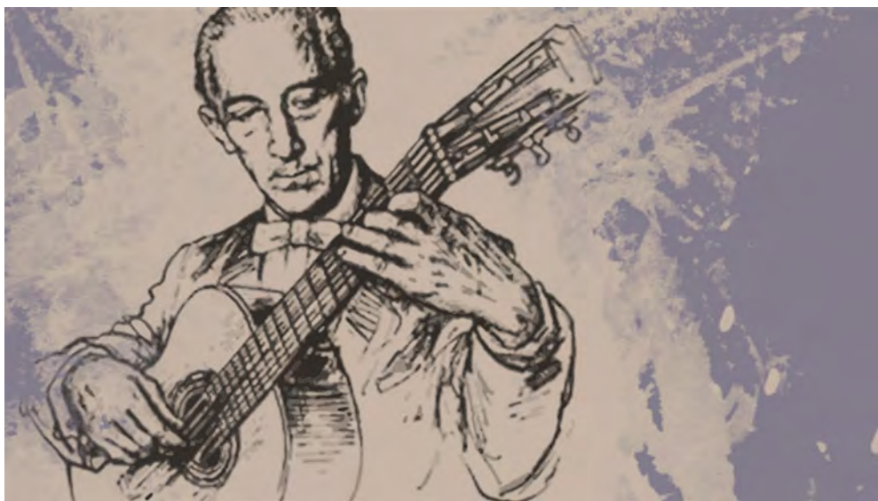
Regino Sainz de la Maza, el guitarrista que estrenó el Concierto de Aranjuez en 1940

La idea de componer un concierto para guitarra surgió en una conversación de sobremesa. Fue en 1938. Durante un viaje de regreso a París, cenó en San Sebastián con el Marqués de Bolarque, diplomático español y gran promotor de las artes y la música, y el guitarrista Regino Sainz de la Maza. El guitarrista comentó que la ilusión de su vida sería tocar un concierto para guitarra y orquesta. El compositor aceptó la propuesta y cumplió su promesa. Lo compuso en París durante el invierno y la primavera de 1939. El adagio , el movimiento más popular de la obra, surgió “de un tirón, sin vacilaciones” y lo mismo ocurrió con el tercer movimiento. El primero, fue el último en componerse. El mayor problema era confrontar el sonido de la guitarra con el de la orquesta y lograr un resultado equilibrado. Rodrigo lo consigue: la guitarra es la protagonista del concierto.